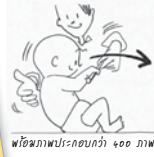
พ็อกเก็ตภาพประกอบกว่า 400 ภาพ

เด็กแรกเกิด-6 ขวบ ด้วยวิธี เล่นกับเขา อย่างง่าย ๆ เพียงวันละ 10 นาที ด้วยตัวคุณเอง