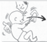
เพียงวันละ 10 นาทีเท่านั้น

"หนังสือเล่มนี้แพร่หลายในนานาประเทศ เป็นที่นิยมและนำไปใช้ได้ผลในเด็ก อ่านง่าย เข้าใจง่าย ดิฉันเองอ่านแล้ววางไม่ลง ...การเล่นกับลูกจะเป็นการกระตุ้นทั้ง หู ตา จมูก ลิ้น กาย ใจ ทำให้ลูกพัฒนาทั้งร่างกาย สมอง การเรียนรู้ และจิตใจ ช่วยให้เด็กอารมณ์ดี มีสุข พัฒนาการดีสมใจพ่อแม่"